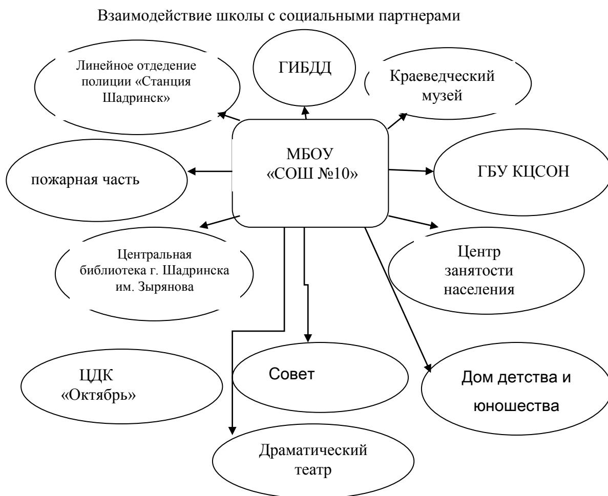
Рисунок 1. «Социальное партнерство»

Школа взаимодействует с социальными партнерами.